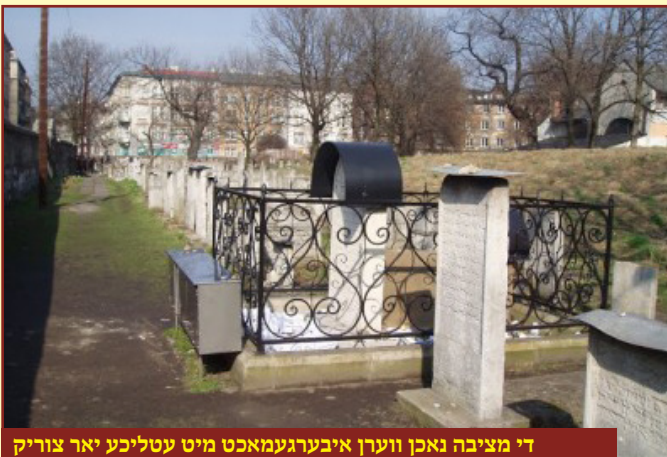
די מציבה נאכן ווערן איבערגעמאכט מיט עטליכע יאר צוריק