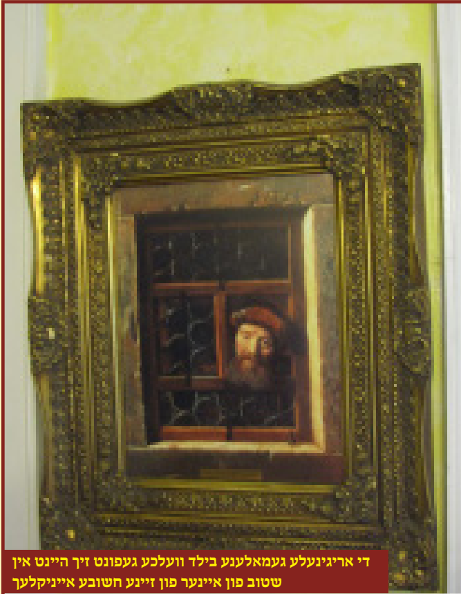
די אריגינעלע געמאלענע בילד וועלכע געפונט זיך היינט אין שטוב פון איינער פון זיינע חשובע אייניקלעך