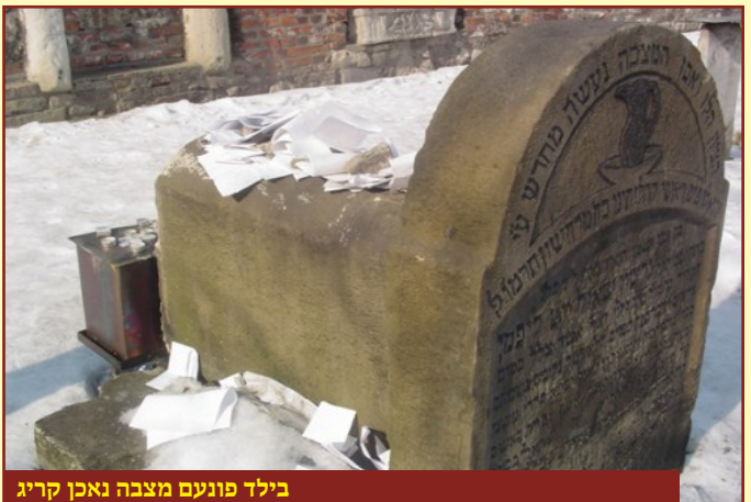
בילד פונעם מצבה נאכן קריג