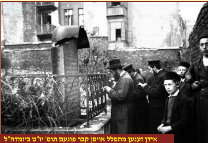
אידן זענען מתפלל אויפן קבר פונעם תוס' יו"ט ביומדה"ל