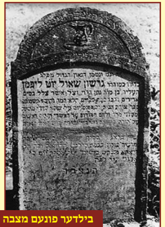
בילדער פונעם מצבה פונעם תוספות יו"ט פון בעפאר די קריג